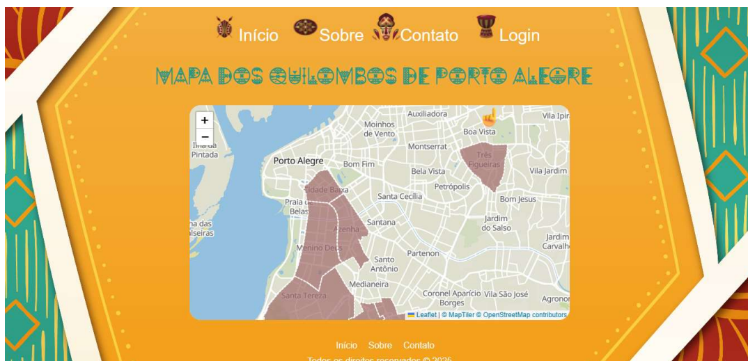
Figura 1- Tela inicial do Mapeando Quilombos

usuário é direcionado para uma nova tela da aplicação, que apresenta uma descrição detalhada sobre a localização, a história, a cartografia e os aspectos religiosos do quilombo. Caso tenha interesse, o usuário também pode fazer o download do conteúdo em formato PDF.