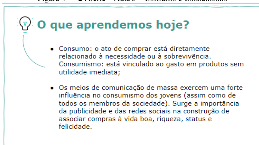
Figura 4 — 2ª. Série – Aula 5 – Consumo e Consumismo