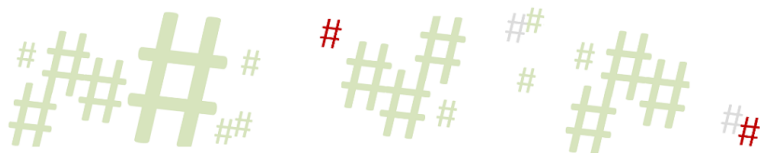
Figura 1 — 1ª. Série – Aula 6 – Movimentos Indígenas e suas estratégias