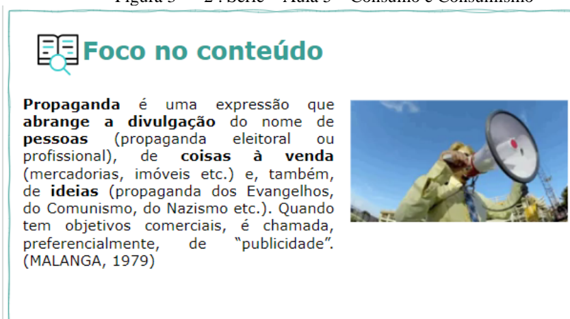
Figura 3 — 2ª. Série – Aula 5 – Consumo e Consumismo