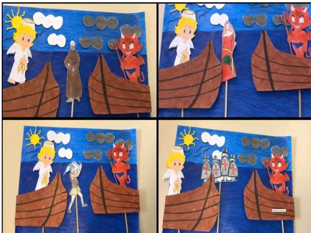
Figura 1 – Book trailer 1 4

Para a apresentação do objeto de análise a partir das produções realizadas pelos estudantes, optou-se pela captura de tela a fim de trazer para a discussão aspectos referentes à intermedialidade, ressaltando-se, dessa forma, questões direcionadas à linguagem verbal, visual, sonora etc. Assim, com base, portanto, na (re)construção para o book trailer , tendo em vista a obra original e o audiovisual como uma nova obra, destaca-se a Figura 1: