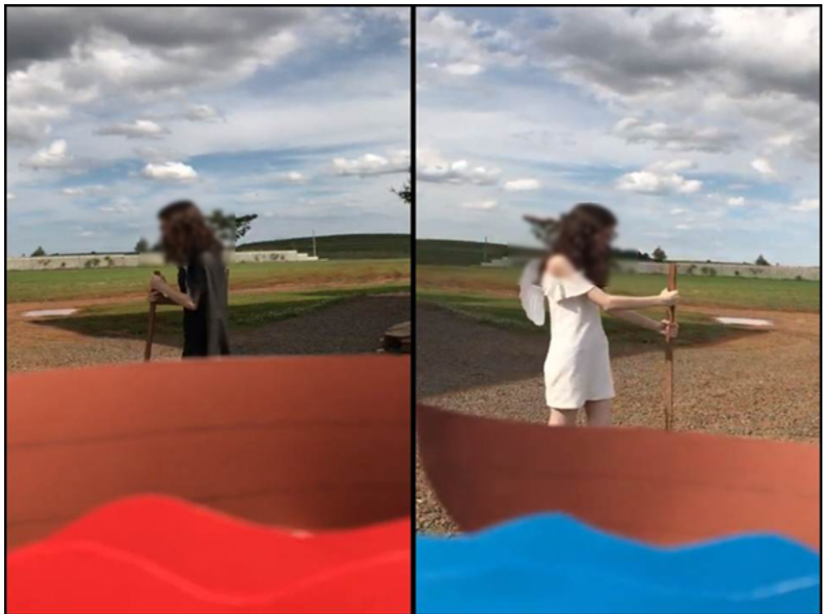
Figura 2 – Book trailer 2

A análise dos book trailers produzidos pelos estudantes do Ensino Médio revela a criatividade e a autoria estudantil, ampliando a narrativa e indo além. Na Figura 2, as estudantes encenam momentos da obra O auto da barca do inferno , de Gil Vicente (2014), construindo oposição entre as personagens do diabo e do anjo: