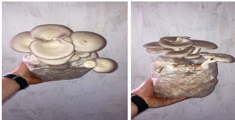
Figura 2 - Produção (frutificação) e ponto de colheita do cogumelo Shimeji .