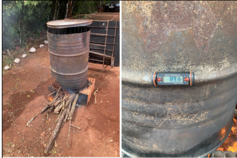
Figura 1 - Tratamento térmico do substrato.

primeiros cogumelos após oito dias de inoculação e a segunda colheita ocorreu 17 dias após a primeira colheita, totalizando assim vinte e cinco dias do início ao fim da colheita e 33 dias de cultivo.