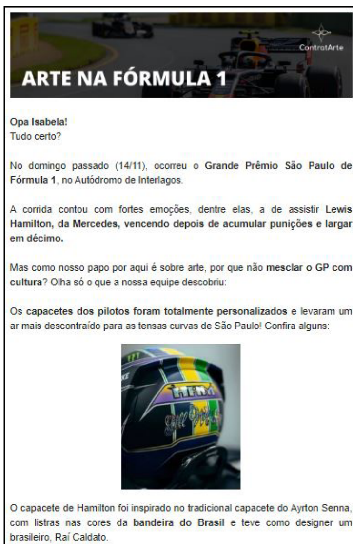
📌 Figura 3. Artletter da ContratArte.

Somando-se a isso, percebeu-se a necessidade de haver uma comunicação para os já cadastrados no site e para aqueles que acompanhavam o projeto mais seguidamente. Com isso, nasceu a Artletter (figura 3), a newsletter da ContratArte. Nela, são enviados textos semanais, por e-mail, contando novidades da plataforma e curiosidades do mundo artístico.