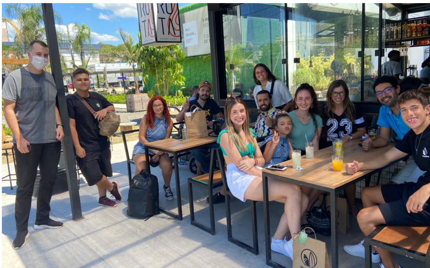
📌 Figura 1. Equipe da ContratArte.

Com muito esforço dos mais de 20 bolsistas que já passaram pelo projeto, além dos orientadores e colaboradores externos (equipe demonstrada na figura 1), a ContratArte vem desenvolvendo diversas ações para melhorar a plataforma, a comunicação dela para com os artistas e para com o público, de modo geral, e também a validação como processo viável e útil aos que usam e aos que venham a usá-la.