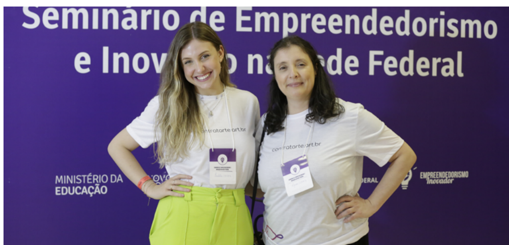
↑ Figura 5. ContratArte no “Seminário de Empreendedorismo e Inovação na Rede Federal”.

É interessante destacar a quantidade de eventos que a ContratArte participou ou realizou, com o intuito de dissipar a ideia e ajudar cada vez mais pessoas com a plataforma. Dentre os eventos, destacam-se o “9º Seminário de Extensão do IFRS Campus Bento Gonçalves”, a “1ª Mostra Metropolitana do IFRS”, o “Desafio Criativo e IFCODE”, o “6º Salão de Pesquisa, Extensão e Ensino do IFRS”, o “Gramado Summit 2021: insights e aprendizados”, a “Oficina de Zapier”, o “7º Salão de Pesquisa, Extensão e Ensino do IFRS” (ganhando destaque) e o “Seminário de Empreendedorismo e Inovação na Rede Federal”, realizado em Brasília, no Instituto Nacional de Estudos e Pesquisas Educacionais Anísio Teixeira (INEP), no qual a ContratArte contratou dois artistas, um caricaturista e um mímico para animar o evento e chamar a atenção do público lá presente. Na figura 5, pode-se observar a participação da ContratArte no evento.