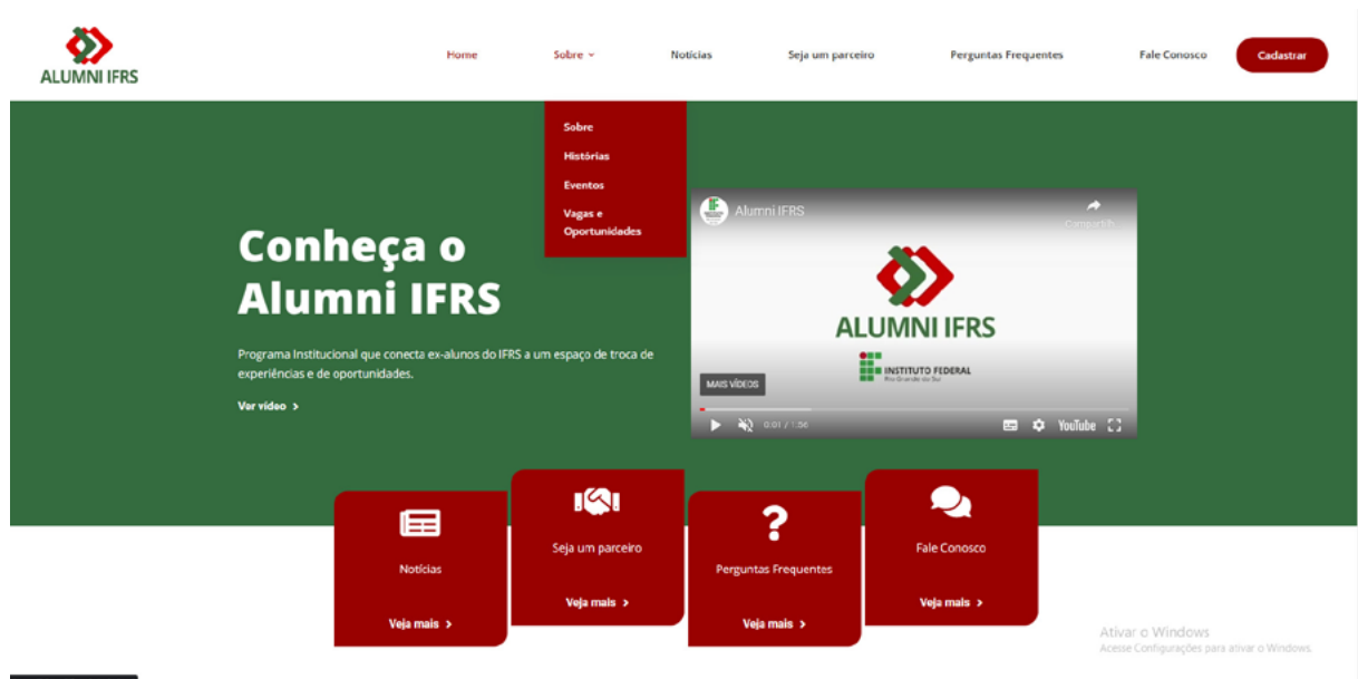
↑ Figura 1. Portal online do Alumni IFRS.

detalhes sobre o funcionamento do programa; eventos, vagas e oportunidades; relatos de ex-alunos; notícias; informações sobre parcerias com outras organizações; contato com a equipe e inscrições.