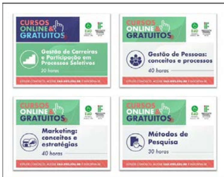
Figura 1. Exemplos de cards de divulgação dos cursos de extensão a distância

Verifica-se, considerando o perfil dos participantes e as demais informações citadas, uma convergência com a missão do IFRS, no que se refere à oferta de uma educação profissional, científica