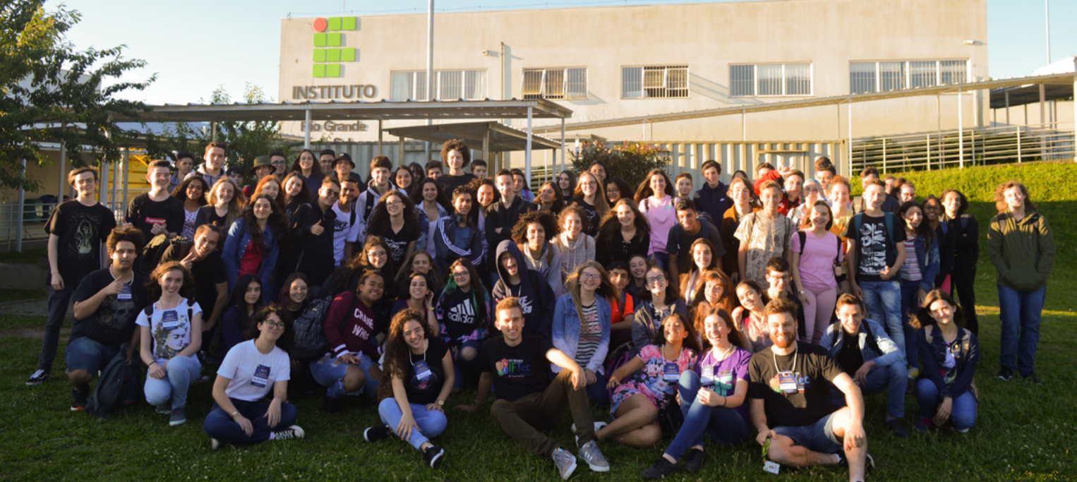
📍 Figura 3. Participantes do projeto Pré-IFRS e estudantes voluntários do IFRS - Campus Caxias do Sul.