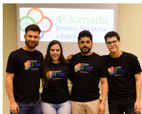
👉 Figura 4. Equipe organizadora do programa Vem Viver o Campus Caxias do IFRS.

Com a junção dos eventos em um único programa, foi possível centralizar a equipe organizadora e, principalmente, permitir uma maior integração entre as ações, que foram fortalecidas e qualificadas. Além disso, estreitaram-se os laços com a comunidade. A participação dos estudantes do campus , como voluntários, foi fundamental para que todas as ações do programa ocorressem da melhor forma possível.