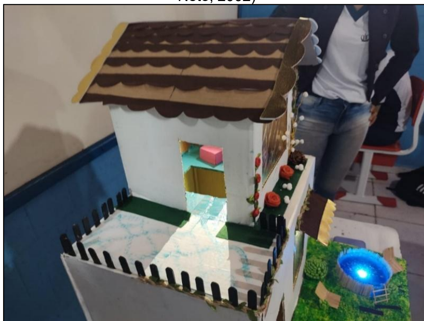
Figura 2 – Maquete “Casa Geométrica”, construída a partir da obra Geometria na Amazônia (Rosa Neto, 2002)