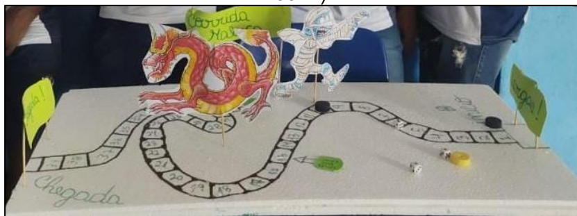
Figura 3 – Jogo “Corrida maluca” construído a partir da obra O segredo dos Números (Ramos, 2001b)