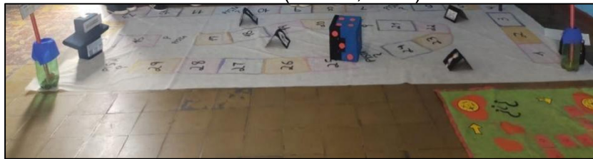
Figura 1 – Jogo “Solucionando um crime polinomial”, construído a partir da obra O Código Polinômio (Ramos, 2007)