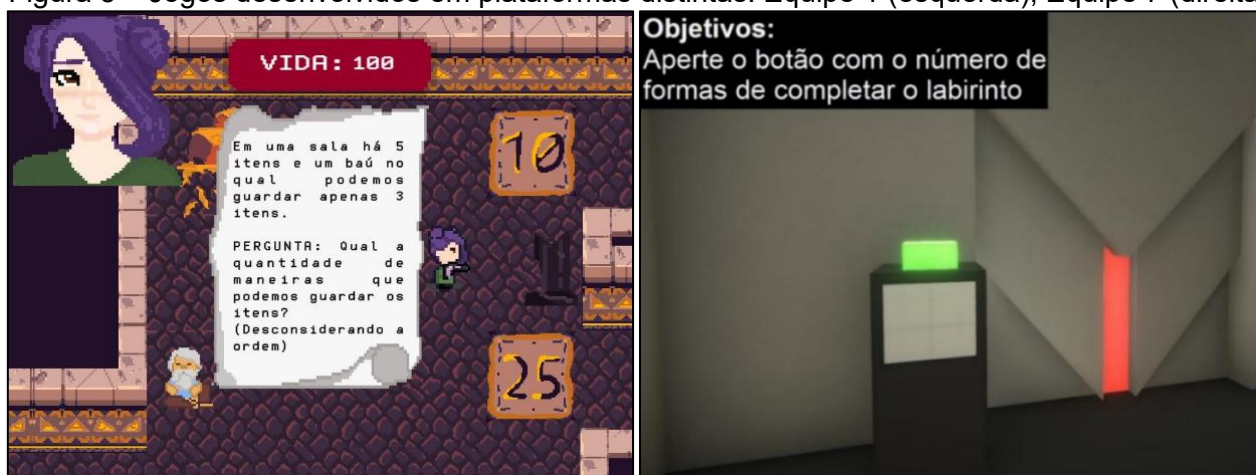
Figura 3 – Jogos desenvolvidos em plataformas distintas: Equipe 1 (esquerda); Equipe 7 (direita)

De modo geral, quanto à proposição dos problemas pelos estudantes, percebeu-se que, de acordo com resultados de pesquisas já realizadas com outro público-alvo, a Proposição de Problemas muitas vezes exige que o propositor do problema vá além dos procedimentos de resolução de problemas para refletir sobre a estrutura mais ampla do problema em si e sobre o objetivo da atividade proposta pelo professor, apresentando uma área repleta de possibilidades para serem desenvolvidas em sala de aula (CAI et al. , 2013; DUARTE, 2020).