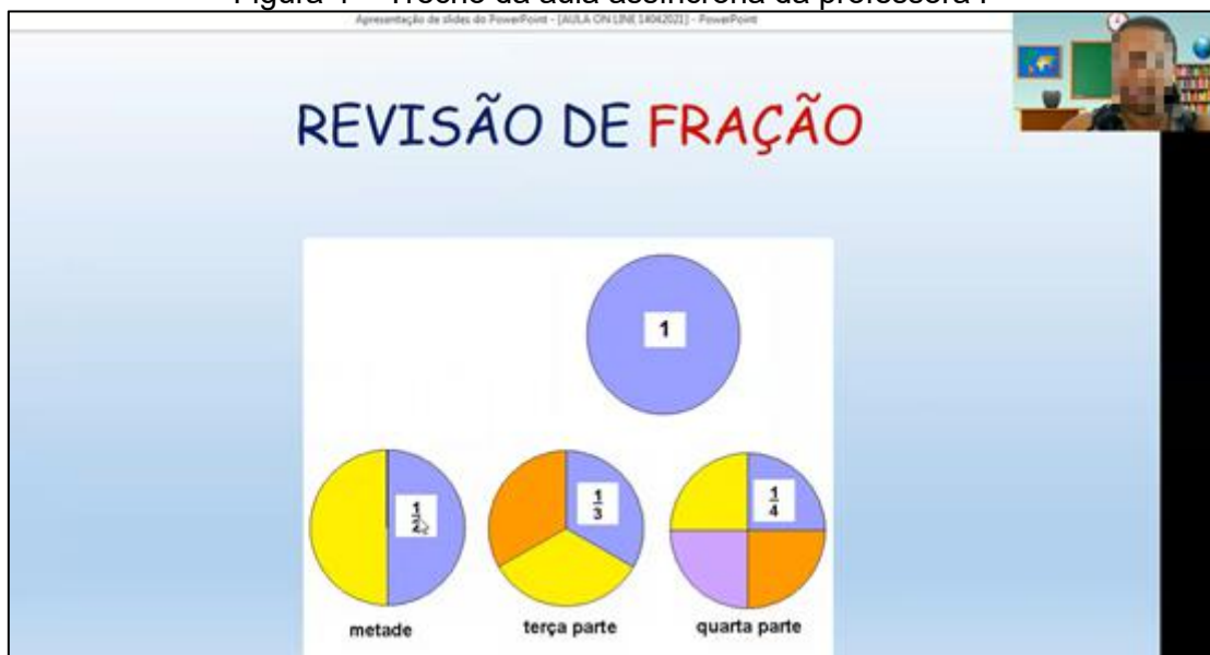
Figura 4 – Trecho da aula assíncrona da professora P

para que não “perdessem a explicação da professora”, um vídeo foi gravado anteriormente com a formalização do conteúdo trabalhado. A segunda estratégia foi a formalização realizada durante a videochamada, utilizando os mesmos slides gravados para a formalização assíncrona, porém permitindo a interação com os alunos em tempo real (Figura 4).