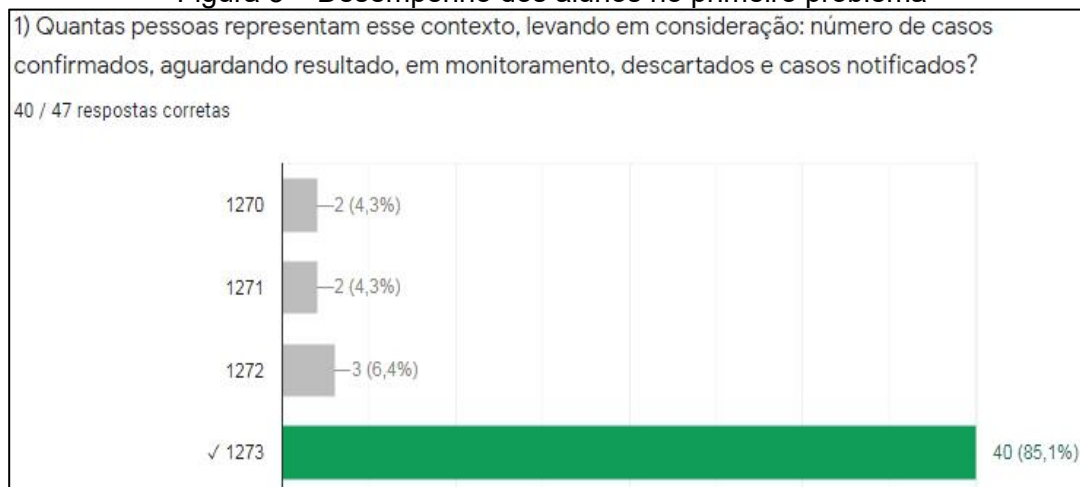
Figura 3 – Desempenho dos alunos no primeiro problema

Nessa ótica, constatou-se que o primeiro problema foi aquele que os alunos tiveram o melhor desempenho. A situação envolvia basicamente a operação de adição. Portanto, bastava adicionar os dados referentes ao número de casos confirmados, aguardando resultado, em monitoramento, descartados e casos notificados para encontrar a solução ( 194 + 22 + 112 + 352 + 593 = 1273 ). Esse aproveitamento chegou a 85,1%, o que significa 40 respostas enviadas corretamente, conforme mostra a Figura 3.