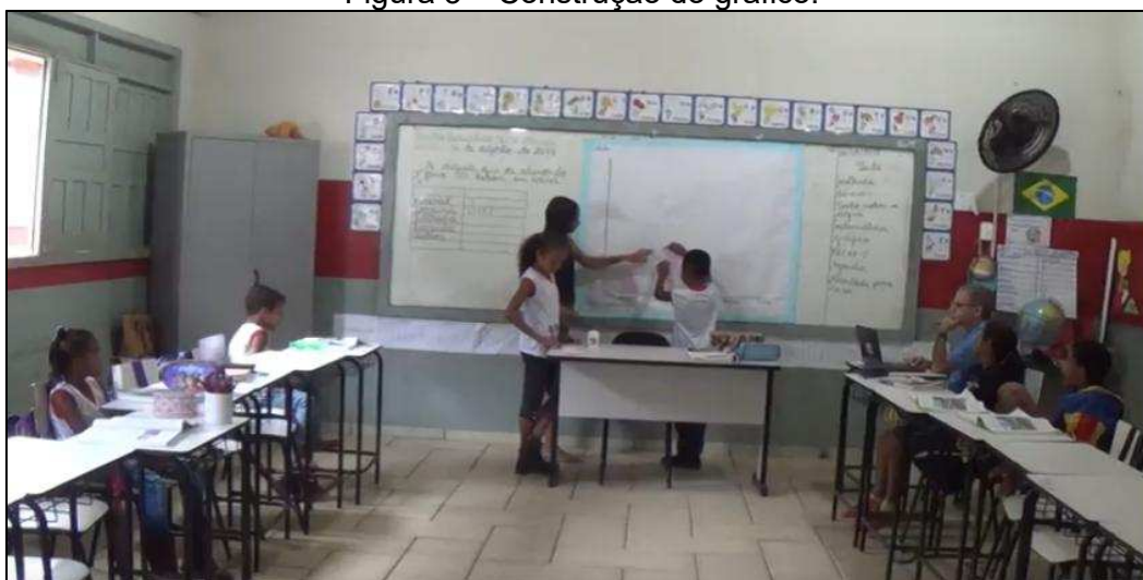
Figura 3 – Construção do gráfico.

Os estudantes referem-se ao gráfico de barras, pois esse era o conhecimento prévio que eles possuíam e com o qual haviam trabalhado anteriormente. Contudo, o gráfico a ser construído refere-se a um pictograma, uma vez que ele utiliza imagens para representar as quantidades. A Figura 3 mostra o momento em que os estudantes, com a orientação da professora, constroem o gráfico.