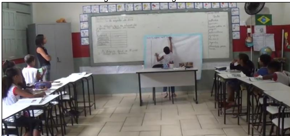
Figura 4 – Título do gráfico.

Depois de formular o título do gráfico, a professora pediu para que um dos estudantes escrevesse o título no cartaz, conforme vemos na Figura 4.