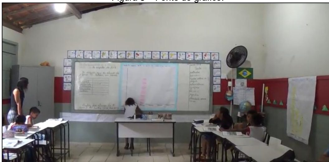
Figura 5 – Fonte do gráfico.

Após a formulação da fonte, outro estudante transcreveu para o cartaz, como é possível ver na Figura 5.