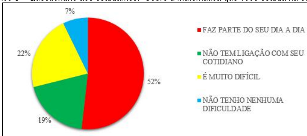
Gráfico 3 – Questionário aos estudantes: “Sobre a Matemática que você estuda na escola”.

Na questão sobre a Matemática que eles estudam na escola, mais da metade dos estudantes respondeu que faz parte do seu dia a dia e 7% diz não apresentar nenhuma dificuldade. O Gráfico 3 mostra os dados coletados ao questionar os alunos sobre o conceito que eles construíram da Matemática estudada na escola.