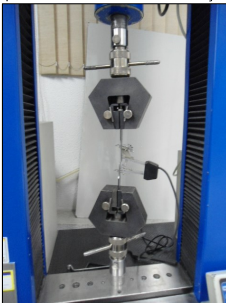
Figura 2 – Equipamento utilizado no ensaio de tração do aço LN-28.