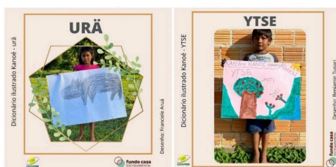
Figura 7: Dicionário ilustrado Kanoé: urä ‘porcão’ e ytse ‘árvore’