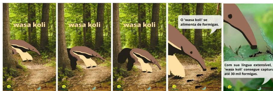
Figura 6: wasa koli 'tamanduá'

O vídeo do wasa koli 'tamanduá' (Fig. 6) mostra um ambiente de floresta, levando o interlocutor a ver os hábitos desse personagem.