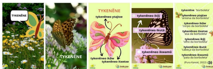
Figura 2: tykenēne 'borboleta' Fonte: elaboração própria. Disponível em @morerekanoe.

Na gravação do áudio para o vídeo da tykenēne 'borboleta' (Fig. 2), foi registrado o uso da marca de possessivo sufixal (-o): 1) tykenēneo ytajtxe 'antena da borboleta', 2) tykenēneo ikāw 'corpo da borboleta', 3) tykenēneo itxetxe 'asa da borboleta', 4) tykenēneo ikj̄j 'olho da borboleta', 5) tykenēneo ikutā 'cabeça da borboleta', 6) tykenēneo ikwamũ 'pata da borboleta'.