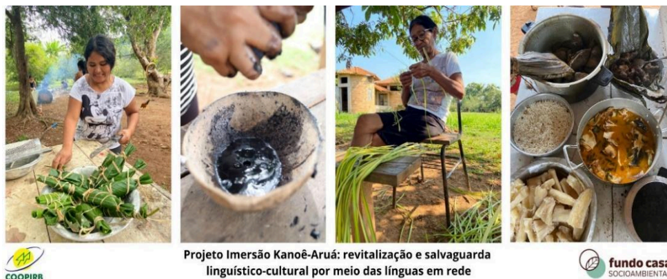
Figura 13: Algumas vivências linguístico-culturais

A Figura 13 apresenta algumas imagens da galeria do projeto, mostrando as seguintes vivências, da esquerda para a direita: 1) Preparando Pakotxi , 2) Preparando tinta de jenipapo, 3) Preparando yki 'marico' e 4) Preparo de alimentos.