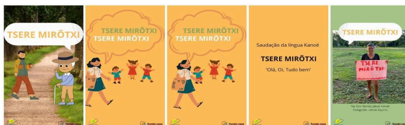
Figura 1: Tsere mirōtxi 'Olá, Oi, Tudo bem' Fonte: elaboração própria. Disponível em @morerekanoe.

A saudação Tsere mirōtxi 'Olá, Oi, Tudo bem' (Fig. 1) foi registrada, primeiramente, pelo linguista Bacelar e atualmente é utilizada nas aulas de língua Kanoé.