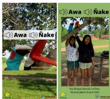
Figura 9: Awa e Ñake 'arara e tucano' Fonte: elaboração própria. Disponível em @morerekanoe.

No processo de criação dos personagens (Fig. 9), as estudantes Alcione e Gieli Aruá com as falas 1) Ñake Kanoé vararoe 'O tucano fala Kanoé' e 2) Awa Kanoé vararoe 'A arara fala Kanoé'.