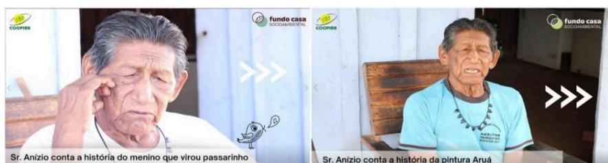
Figura 11: Contação de histórias pelo Sr. Anízio Aruá