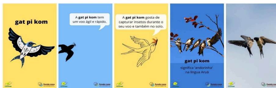
Figura 5: gat pi kom 'andorinha'

Da mesma forma, o vídeo da gat pi kom 'andorinha' (Fig. 5), apresenta informações sobre os seus hábitos e, também combinando a língua Aruá com o Português, com a intenção de destacar o nome do pássaro na língua Aruá.