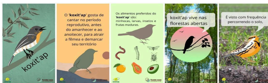
Figura 4: koxit'ap 'sabiá'

No vídeo do koxit'ap 'sabiá' (Fig. 4), foram incluídas informações sobre os hábitos do passarinho, com o objetivo de estimular a criação de novos conteúdos que contenham esse tipo de informação, contribuindo para a aprendizagem.