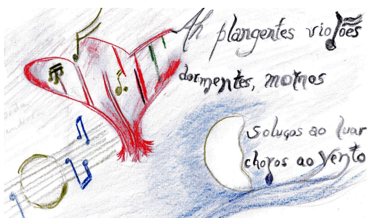
Figura 4. Vibração das cordas tendíneas dos “violões que choram”

A ilustração abaixo serve de modelo de cruzamento entre as artes plásticas, a música e a poesia, no poema “Violões que choram”, de Cruz e Sousa (2008):