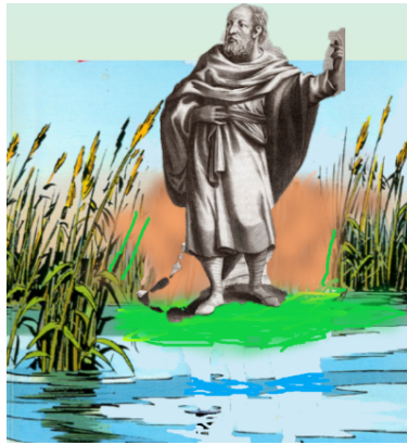
Figura 3. Carnéades diante da areia movediça

O filósofo, ainda que duvide de todas as posições dogmáticas, necessita de um posicionamento prático, pragmático; caso contrário, morreria de fome. Qual o caminho deve ser seguido, se todos são duvidosos? A resposta de Carnéades é: o mais provável. O probabile , também para Cícero, constitui uma norma a ser seguida em todas as questões práticas e existenciais, e, assim como Carnéades dará um passo após o outro, no terreno com areia movediça, procurando evitar ser engolido pelo chão, Alberto Caeiro adotará o olhar – o puro olhar – como única atitude válida diante do conflito da existência – para não ser engolido pela vida.