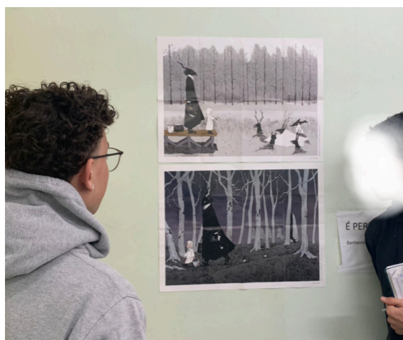
Foto 1. Alunos analisando os pôsteres.

Na etapa um, conforme descrita no quadro interativo, os alunos realizaram a análise dos pôsteres, os quais foram colados na parede da sala de aula para que visualizassem. Em um primeiro momento, houve uma exploração conjunta, na qual os estudantes levantaram hipóteses sobre quem eram os personagens; o que representavam os ambientes; as diferenças entre os personagens, os ambientes e as cores. Para melhor direcionamento da atividade, em alguns momentos, houve intervenção da professora para que percebessem e analisassem alguns elementos específicos. Além dos já mencionados, também se comentou sobre a presença de um ser misterioso sempre observando os dois personagens em maior destaque e a presença de um ser misterioso camuflado. Entre as especulações, as mais mencionadas pelos alunos foram (a) a existência de um mundo dos mortos e outro dos vivos e (b) os sonhos que representam os medos da menina.