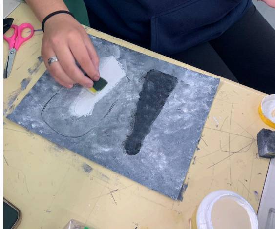
Foto 3. Aluna realizando sua produção artística.