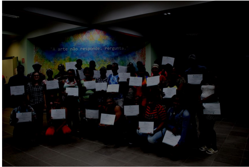
Figura 1: Turma do Módulo I.