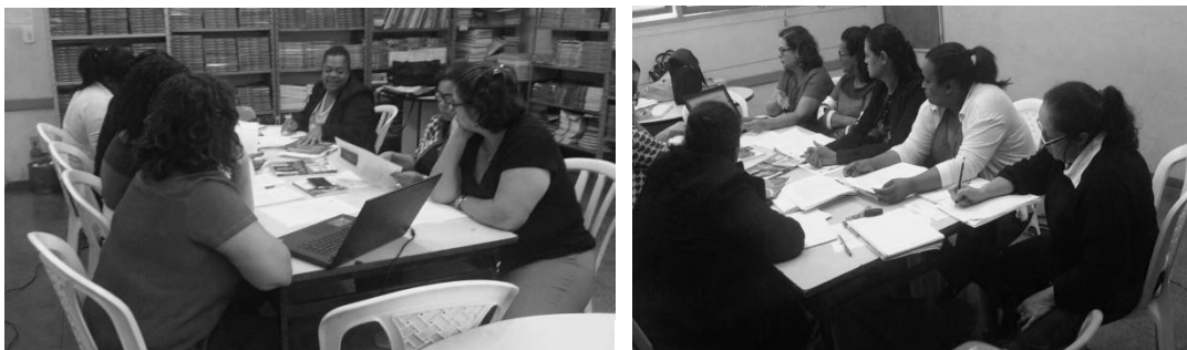
Fotografias 3 e 4: Encontros com as professoras da escola pública de Mariana

A terceira atividade significativa do projeto de extensão foi realizada durante a “Semana de Inclusão, Juventude e Diversidade”, promovida pela 25ª Superintendência Regional de Ensino (SER) de Ouro Preto. A semana foi composta por várias atividades, entre elas, palestras e minicursos oferecidos aos professores e servidores do Estado de Minas Gerais.