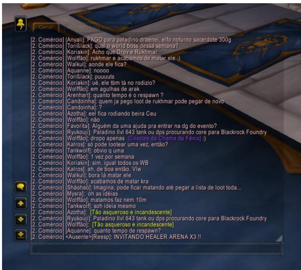
Figura 3: Detalhes do chat.