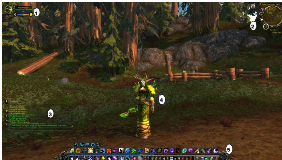
Figura 1: Tela do jogo World of Warcraft .

A tela do jogo é composta por alguns elementos que estão destacados em números (Figura 1). O item número 1 representa o retrato do personagem, nele estão identificados seu nível, a barra de vida com quantidade total ou o percentual da vida e o principal recurso do personagem; o 2 é o minimapa e itens de addons 10 instalados pelo jogador; o 3 indica a janela de chat 11 na qual a comunicação por mensagens públicas entre os jogadores é realizada. Todos os jogadores têm acesso ao chat. Para conversas privadas, existe outro canal de comunicação. No 4 está representado o personagem do jogador e o item 5 indica a barra de habilidades do personagem.